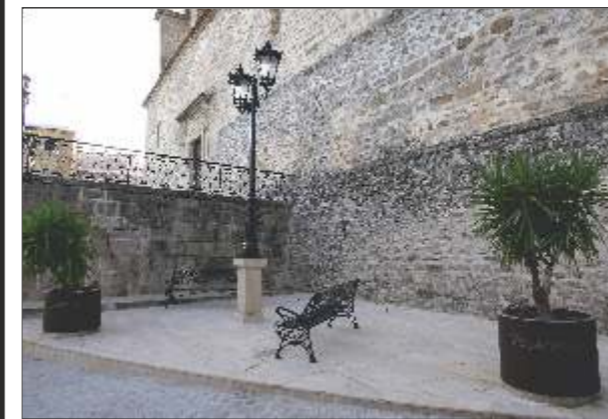
Villacarrillo: Zona de descanso junto a la Parroquia