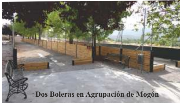
Dos Boleras en Agrupación de Mogón