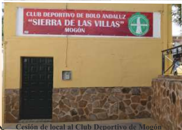
Cesión de local al Club Deportivo de Mogón