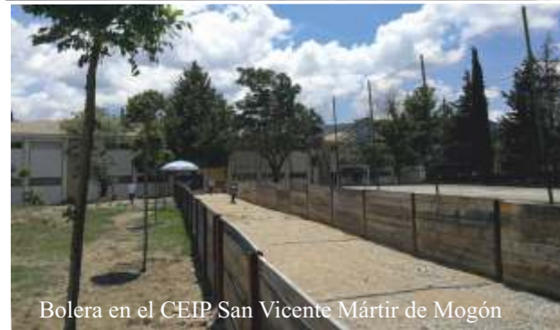
Bolera en el CEIP San Vicente Mártir de Mogón