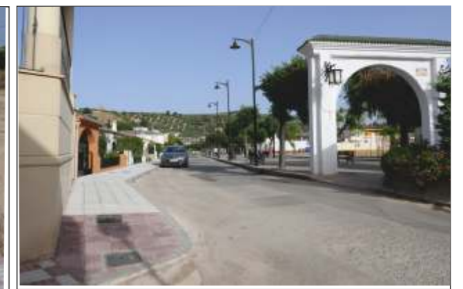
Mogón: Acerado en Paseo La Alameda