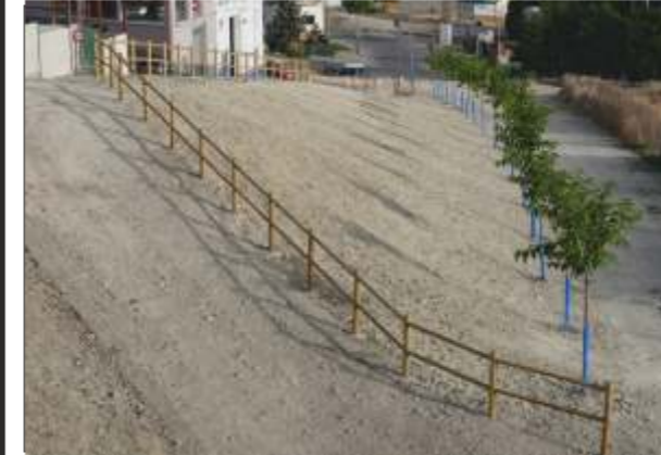
Villacarrillo: Zona Verde en Pilar de La Alameda