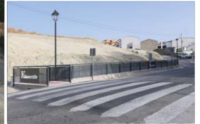
Villacarrillo: Acerado y paso Elevado Ctra. Mogón