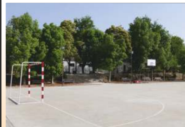
Agrupación Mogón: Infraestructuras deportivas