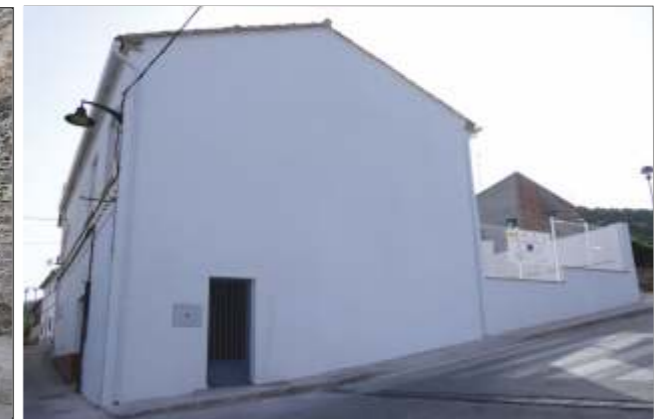
Mogón: Salón Usos Múltiples "Casa del Pueblo"