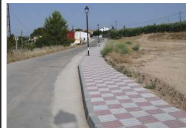
La Caleruela: Dotación de Servicios Urbanísticos