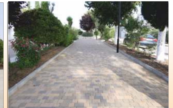
Arroturas: Paseo FASE I